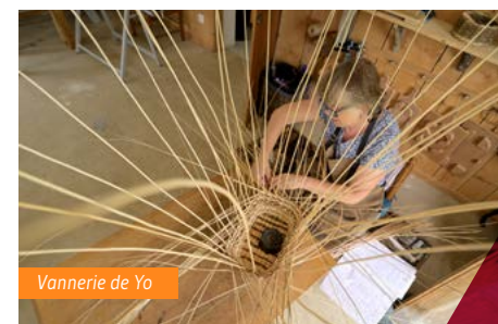
Vannerie de Yo