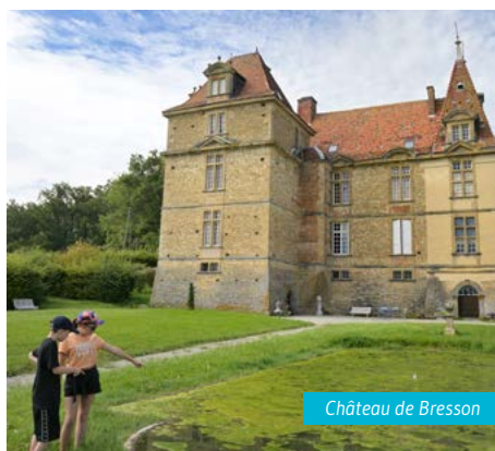
Château de Bresson